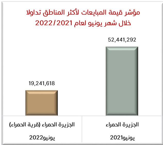
رسمه رقم (3)