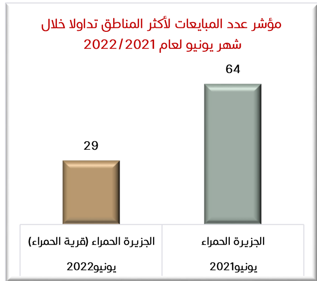
رسمه رقم (2)