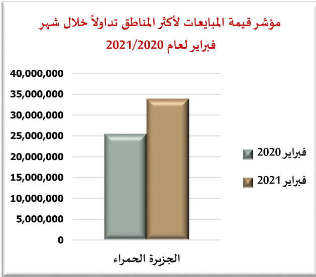
رسمه رقم (3)